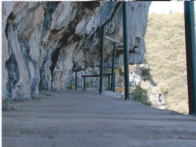
Ouvrage serpentant à flanc de falaise calcaire