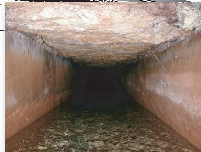
Canal de 0,70 x 0,70 m en service depuis 1892